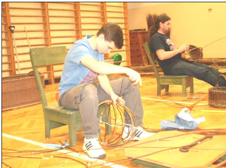
Zajęcia praktyczne na pierwszym kursie koszykarz–plecionkarz, 23.01.2015 r.

Drugi kurs ruszył już 5 września 2015 roku. Na rozpoczęciu roku naukę podjęło 37 osób, wypełniając całą salę gimnastyczną „medyka”. Naukę rozpoczęły osoby pracujące już wiele lat w zawodzie, nauczyciele zawodu, wikliniarze, floryści, rękodzielnicy, a także hobbyści, którzy wykazywali duże zaangażowanie i determinację. Nauka odbywała się systematycznie w każdy następujący po sobie weekend. W piątek od godziny piętnastej do niedzieli do godziny piętnastej, z przerwą w porze nocnej na odpoczynek. Chęci i zaangażowania nie brakowało nikomu. Rosnąca motywacja, wraz ze wzrostem świadomości coraz szerszych umiejętności, przejawiała się pomysłami na wykonanie nowych wzorów, dalece przewyższających ramy określone w podstawie programowej. Kurs zapadł w pamięci tych wszystkich, którzy mieli okazję w nim uczestniczyć, ponieważ nie udało się już nigdy więcej powtórzyć takiego poziomu kształcenia umiejętności. Kurs ukończyły 24 osoby, egzamin pozytywnie złożyło 22. uczestników kursu. Warto zauważyć, że niektórzy absolwenci w sposób szczególny w nieodległym czasie wyróżnili się m.in. jako autorzy podstawy programowej z 2019 roku, na której kolejne „po-