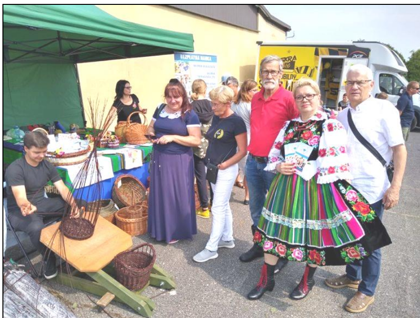
Promocja szkoły na dożynkach wojewódzkich w Rogowie, 22.08.2021 r.

Okazją do zaprezentowania umiejętności uczestników kursu na poziomie lokalnym są coroczne kiermasze bożonarodzeniowe i wielkanocne organizowane na terenie szkoły. Podczas tych wydarzeń stoisko plecionkarzy niezmiennie cieszy się dużym zainteresowaniem. Oferuje, obok tradycyjnych koszyków, takie formy jak: wianki, choinki, rzeźby zwierząt czy wiklinowy bałwan.