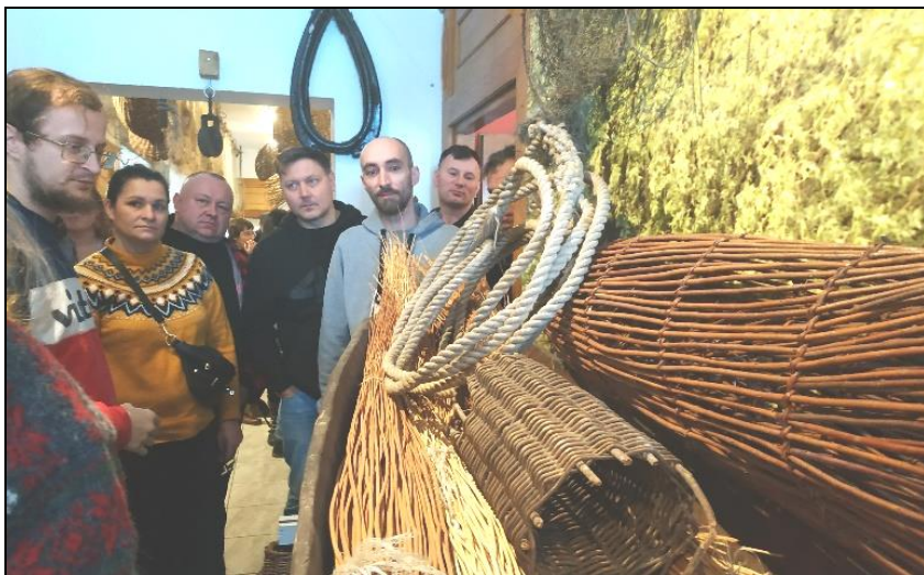
Wizyta plecionkarzy w Muzeum Wisły w Wyszogrodzie, 06.01.2024 r.

Zwieńczeniem spotkania były warsztaty plecionkarskie, na których można było wykonać koszyk wikowy – tradycyjny kosz wyplatany w gminie Ciężkowice wpisany na Krajową Listę Niematerialnego Dziedzictwa Kulturowego.