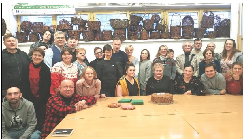
Spotkanie plecionkarzy w pracowni ZSiPOWŁ w Łowiczu, 06.01.2024 r.