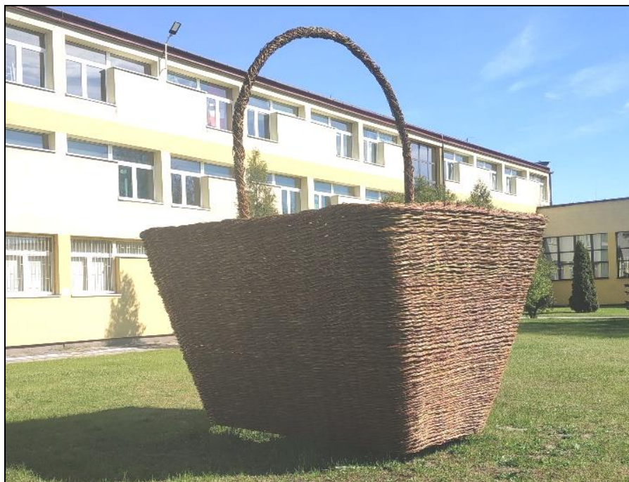
Wiklinowy kosz gigant wykonany na wzór kosza znajdującego się w zbiorach Muzeum w Łowiczu