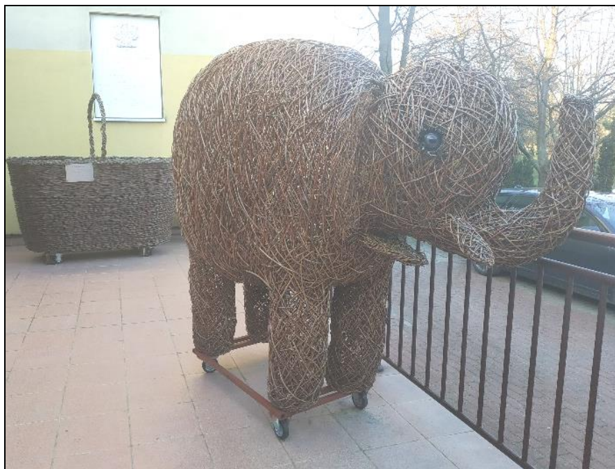
Wiklinowy słoń znajdujący się przed wejściem głównym do budynku szkoły

Ósma edycja kursu 2021/2022 zmieniła fizycznie swoje miejsce, przeprowadzając się do zaadaptowanych na pracownię plecionkarską pomieszczeń po nieistniejącej od kilku lat pralni w oddzielnym budynku obok szkoły. Stała pracownia stworzyła możliwość realizowania projektów przewidzianych na kilka miesięcy. W ten sposób powstają wiklinowe ptaki i inne zwierzęta, w tym także słoń. Podjęto próbę łączenia różnych materiałów.