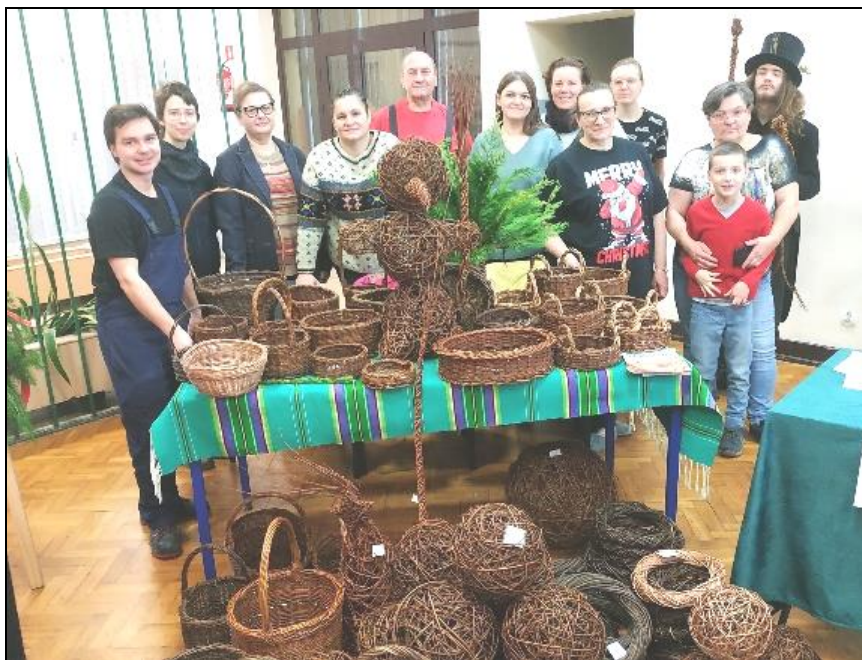
Uczestnicy kursu koszykarz–plecionkarz wraz z nauczycielem na kiermaszu bożonarodzeniowym